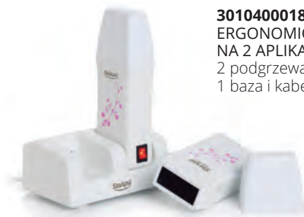
3010400018* ERGONOMICZNY NA 2 APLIKATORY 2 podgrzewacze 1 baza i kabel