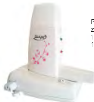
Podgrzewacz pojedynczy LUX z bazą i termostatem 1 podgrzewacz 1 baza i kabel