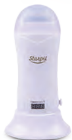
3010401002 PODGRZEWACZ NA 1 APLIKATOR Z TERMOSTATEM Szybkie podgrzewanie wosku. Regulacja temperatury (30-105 ° C) Cyfrowy wyświetlacz temperatury w ° C Moc: 40 W (110/220 V · 220/240 V · 50/60 Hz)