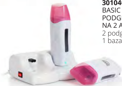
3010400035 BASIC PODGRZEWACZ NA 2 APLIKATORY 2 podgrzewacze 1 baza i kabel