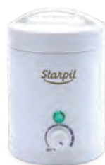
3010409007 PODGRZEWACZ DO WOSKU DO TWARZY 200 ml Szybkie podgrzewanie wosku Regulacja temperatury (45-90 ° C) Lampka włącz / wyłącz Kompaktowy

Wymiary: 116 x 116 x 147 mm Moc: 40 W (110/220 V · 220/240 V · 50/60 Hz)