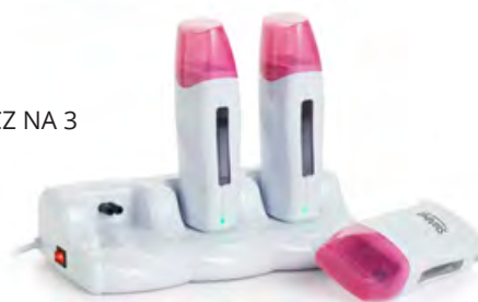
3010400036 BASIC PODGRZEWACZ NA 3 APLIKATORY 3 podgrzewacze 1 baza i kabel