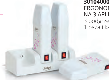
3010400022* ERGONOMICZNY NA 3 APLIKATORY 3 podgrzewacze 1 baza i kabel